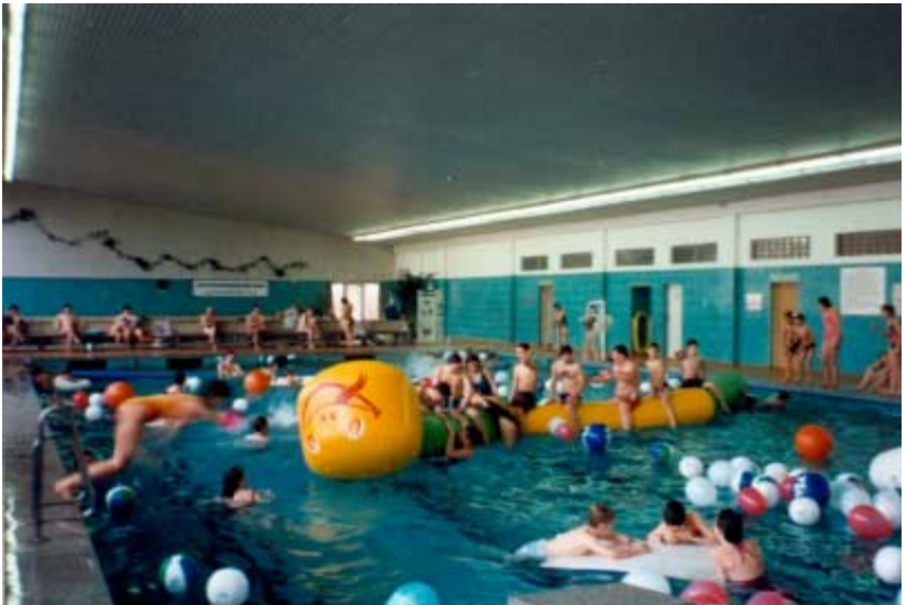
11.04.94 - Start des Projektes "Behinderte Kinder – auch wir sind wer" in Hettstedt.