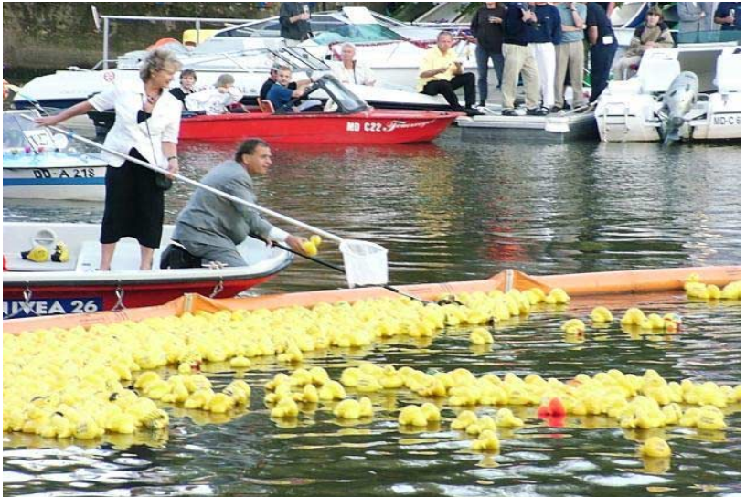
66. Laternenfest in Halle/Saale - Auf einem DLRG Boot fahren die Oberbürgermeisterin I. Häußler und der Ministerpräsident R. Höppner mit

80 Besucher des Festes schwimmen durch die Saale ans andere Ufer und wieder zurück, wo sie gestartet sind. RS waren im, am und auf dem Wasser um zu sehen, daß alle das Ufer erreichen.