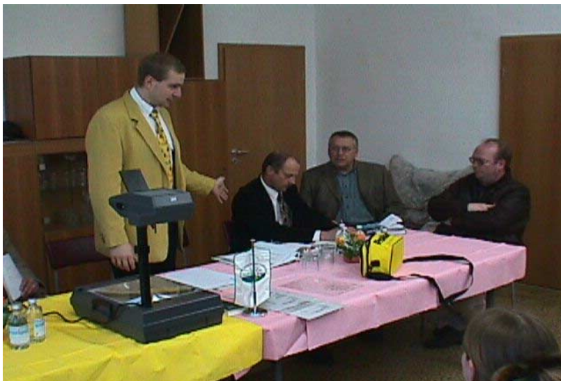
Bei der Ortsgruppe Mansfelder Seekreis am Süßen See