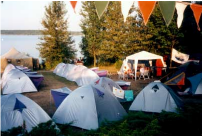
07/97 - Zelten in Pouch am Muldestausee