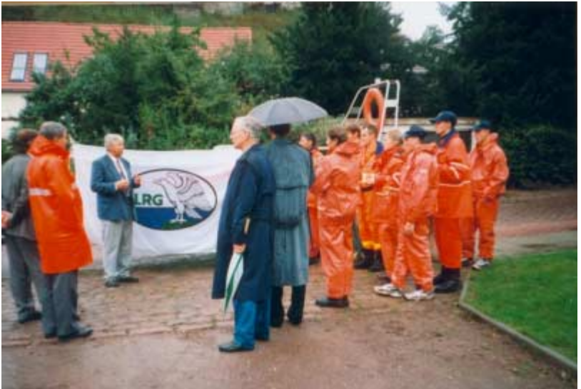
12.09.98 - Bootstaufe in Wettin