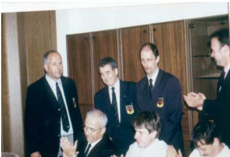
04.05.96 LV-Tagung im Ruderhaus Halle