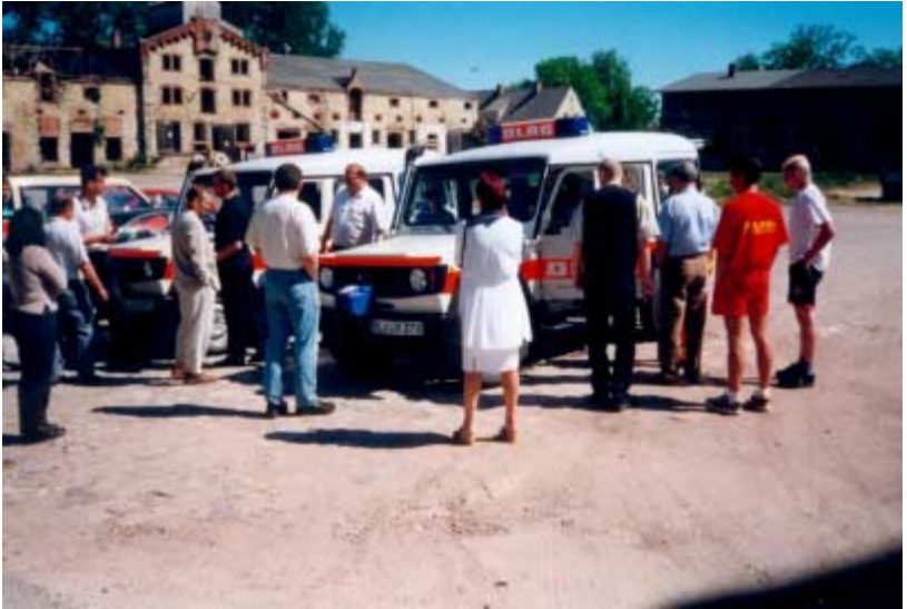
12.-14.05.2000 LV-Ratstagung in Peseckendorf