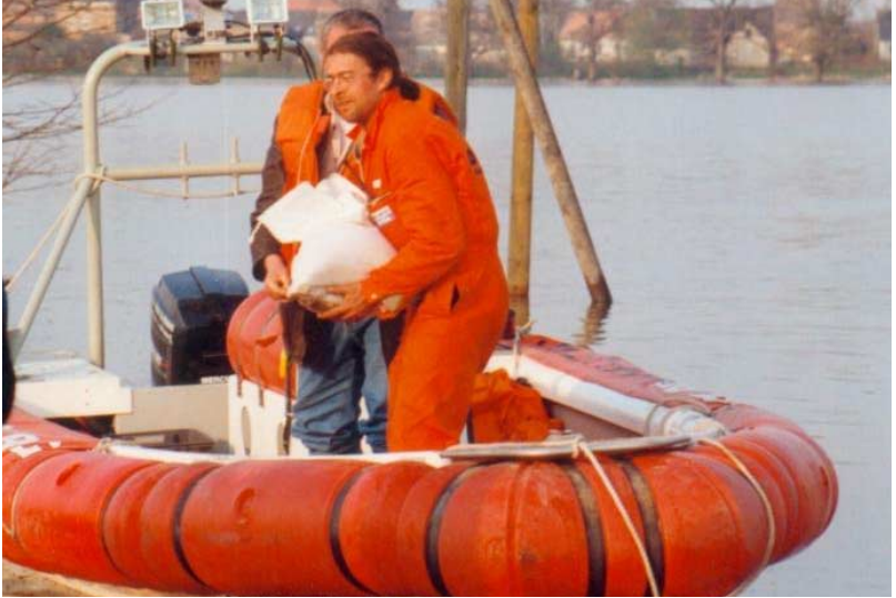
13.-22.04. Hochwassereinsatz in Sachsen-Anhalt