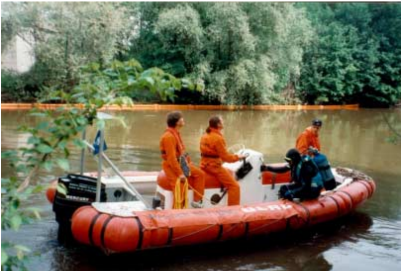
28.05.94 - Tag der Ehrenamtlichen in Merseburg - Taucher und Bootsführer bei Vorführungen