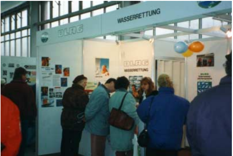
24.-27.02.94 - Die DLRG ist mit ihrem Landesverbands-Messestand wieder zur Freizeitmesse auf der Peißnitz präsent.