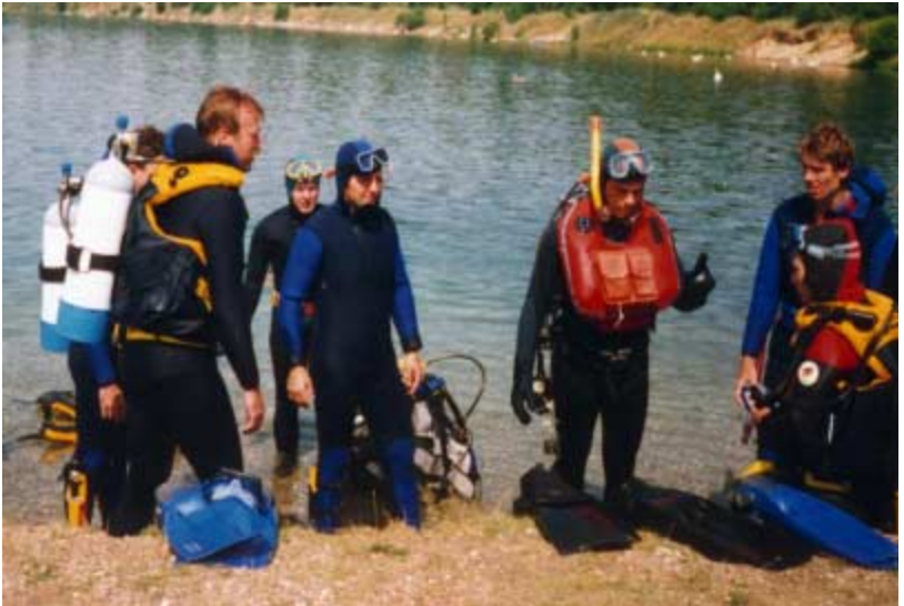
07/92 - Am Kulkwitzsee bei Leipzig legen Rettungsschwimmer aus Sachsen-Anhalt ihre Tauchprüfung ab.