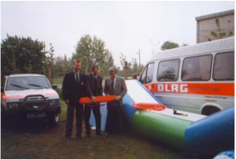
05/95 LV-Tagung in Halle - Übergabe des neuen Spielmobils