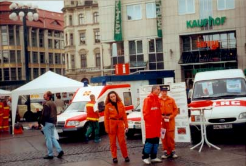
20.09.97 Erste-Hilfe-Tag auf dem Marktplatz in Halle