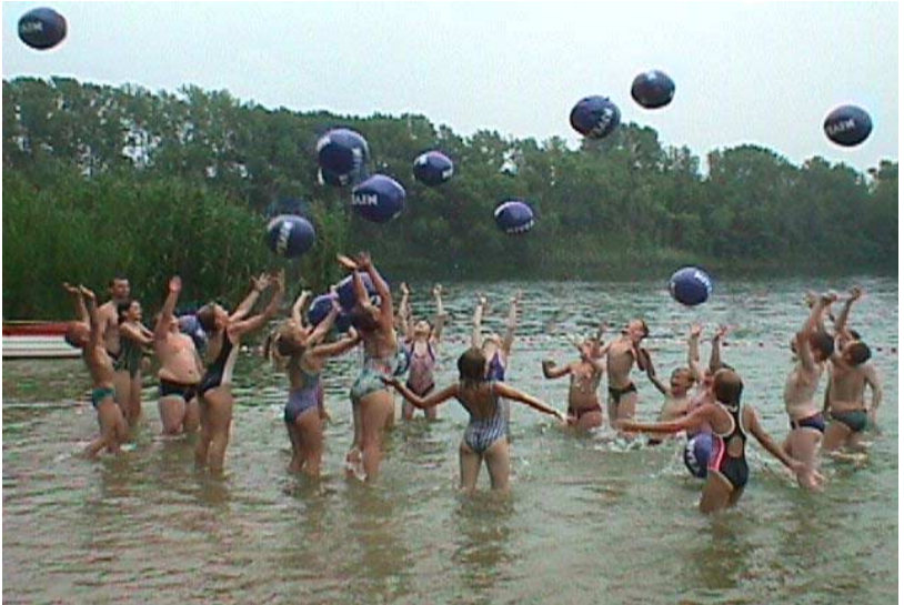
Aktionstag im Strandbad Pappelgrund