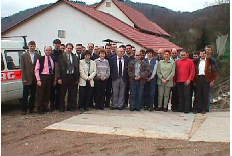
6./7.03.99 - LV-Ratstagung in Wiehe