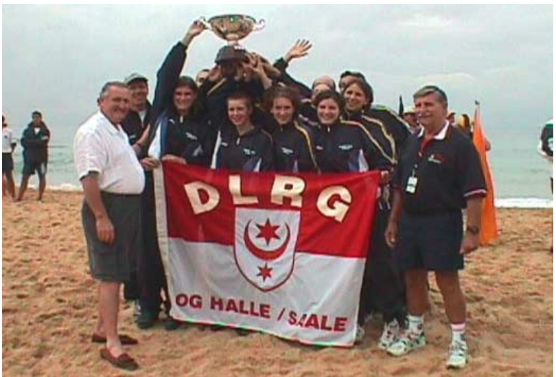
23.-27.3.00 - Weltmeisterschaften im Rettungsschwimmen in Sydney/Australien