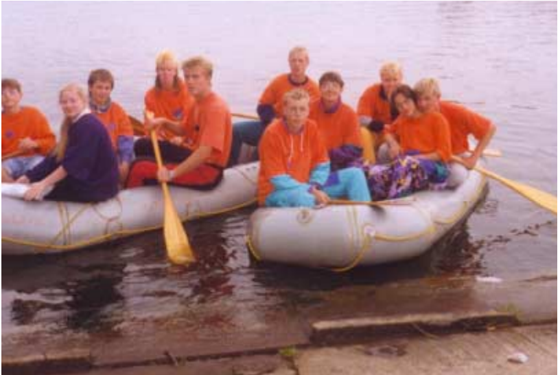
10./11.07.93 - Jugendliche der OG Hettstedt auf dem Süßen See