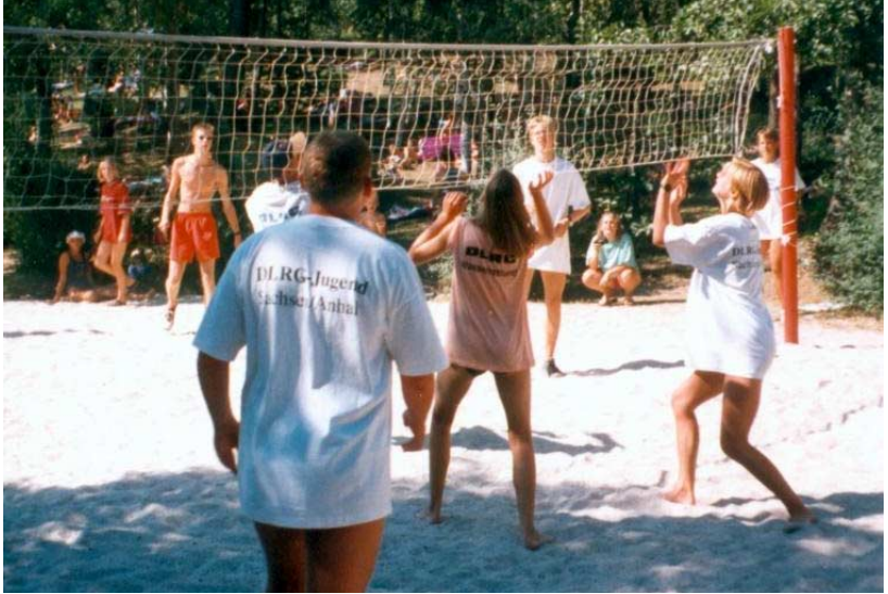
11.-13.08.95 - 3. Landesjugendtreffen im Strandbad Pappelgrund