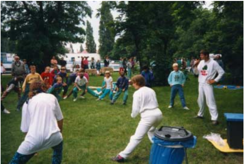
27.06.93 - Erstes Landesjugendtreffen unter dem Motto "80 Jahre DLRG" im Sommerbad Ammendorf