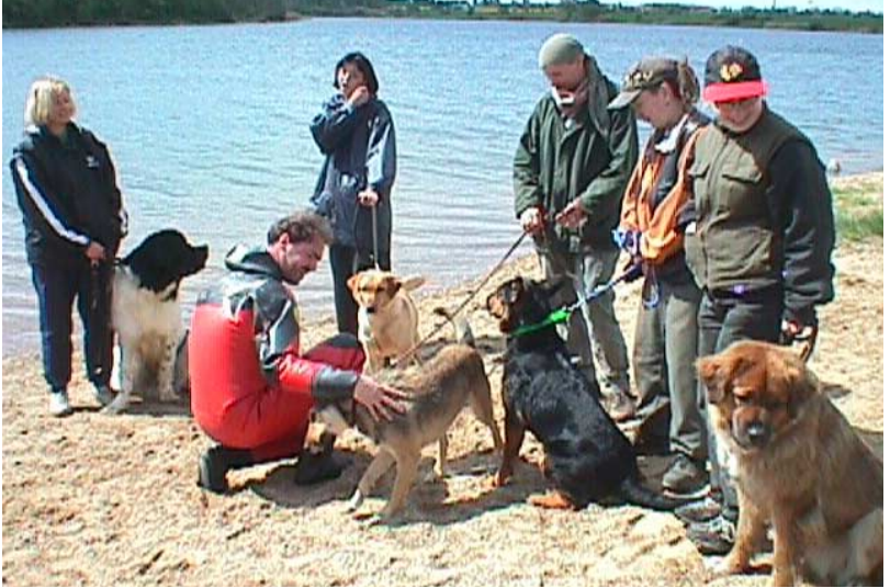
05/99 - Taucheinsatz mit Rettungshunden