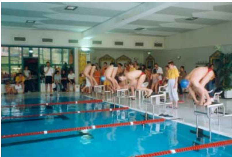
24.-25.04.99 Landesmeisterschaften in Wernigerode