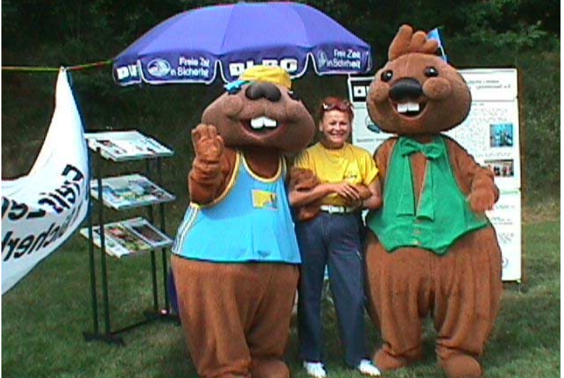
10.07.98 - 3. Landesjugendspiele von Sachsen-Anhalt in Magdeburg