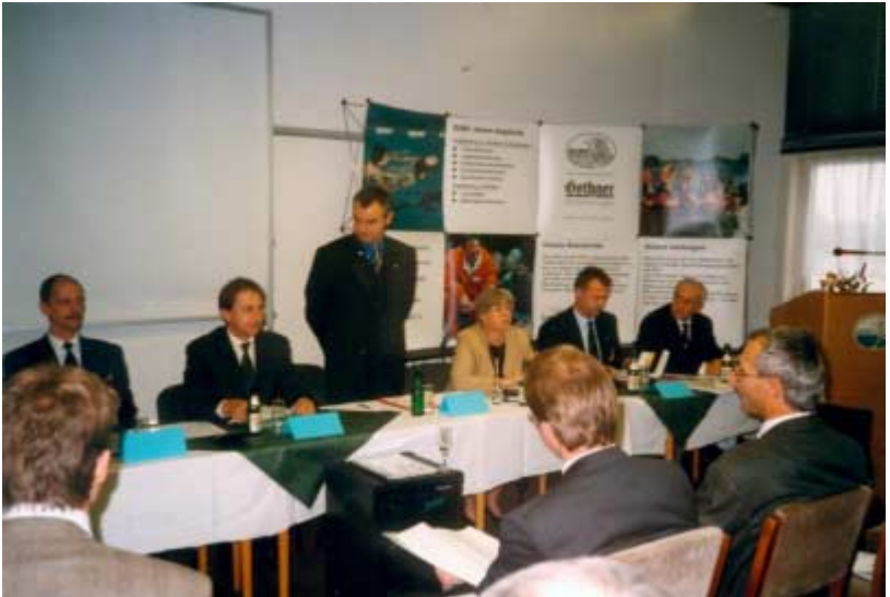
09.11.98 - Bilanzkonferenz in Magdeburg