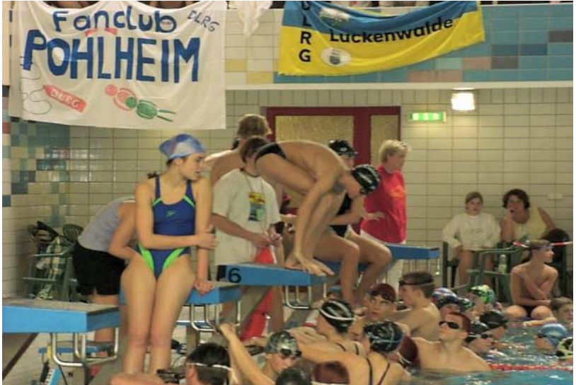
28. Deutsche Meisterschaften im RS in der Schwimmhalle Halle-Neustadt