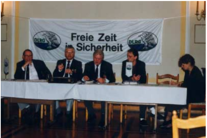
22.02.91 - Der Landesverband Sachsen-Anhalt wird in Halberstadt gegründet